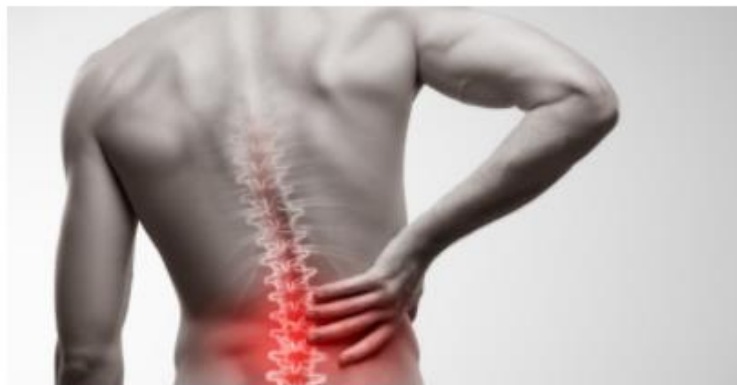
Schmerzen, insbesondere Rückenschmerzen, verursachen jedes Jahr wirtschaftliche Schäden in Milliardenhöhe.

Schmerzen sind ein Problem für Individuen sowie eine Herausforderung für Gesundheitssysteme, Volkswirtschaften und die Gesellschaft insgesamt: Jedes Jahr ist etwa jeder fünfte Europäer in Europa von chronischen Schmerzen betroffen. Die geschätzten direkten und indirekten Gesundheitskosten für chronische Schmerzstörungen in den europäischen Mitgliedstaaten variieren zwischen zwei und drei Prozent des BIP in der EU. Für das Jahr 2016 würde diese Schätzung bis zu 441 Milliarden Euro betragen.