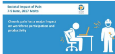
( La douleur chronique a un impact majeur sur la participation et la productivité des travailleurs )

Sous les auspices de la présidence maltaise du Conseil