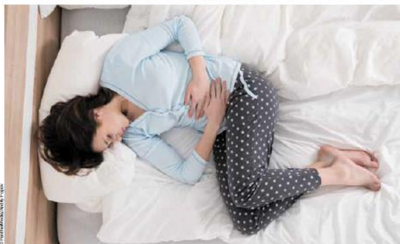
Experten gehen davon aus, dass etwa ein Fünftel der Menschen an chronischen Schmerzen leidet.

Bei einer Konferenz diskutierten Schmerzexperten den steigenden Konsum von Schmerzmitteln und Therapien.